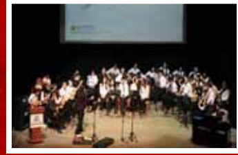
GENÇLİK ŞÖLENİ ZKS GENÇLİK KONSERİ