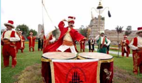
İBB KENT ORKESTRASI | 30 MAYIS ÇAR. MEHTER TOPLULUĞU | Saat: 20:00