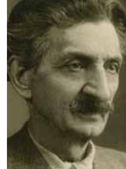
İbnülemin Mahmut Kemal İnal