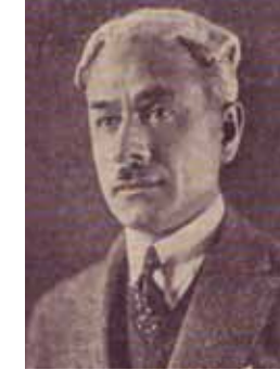
Hamdullah Suphi Tanrıöver