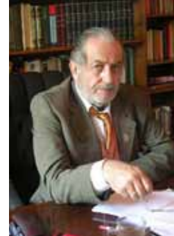
Konuşmacı Tarihçi Kadir Mısıroğlu