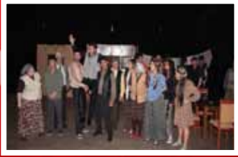
GENÇLİK ŞÖLENİ ZKS TİYATRO GÖSTERİSİ; 'MURTAZA'