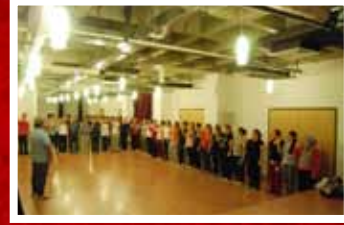
ZKS KURS ÖĞRENCİLERİ HALK OYUNLARI