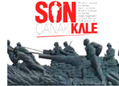
Son Kale Çanakkale