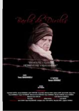
Eser: Yavuz Bahadırođlu Uyarlayan-Yöneten: Kenan Korkmaz