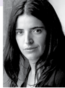
Dağın Ardına Bakmak Bejan Matur