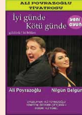
Yönetmen: Özdemir Çiftçiođlu

YER: ZEYTINBURNU KÜLTÜR VE SANAT MERKEZİ