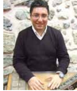
Kanun Atilla Akıntürk