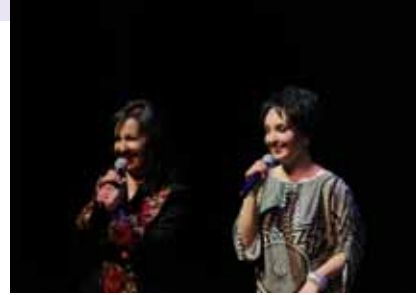
Huysuz ve Tatlı Kadın Grup Türk Kahvesi