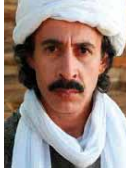
Konuk Mürşüt Ağa Bağ