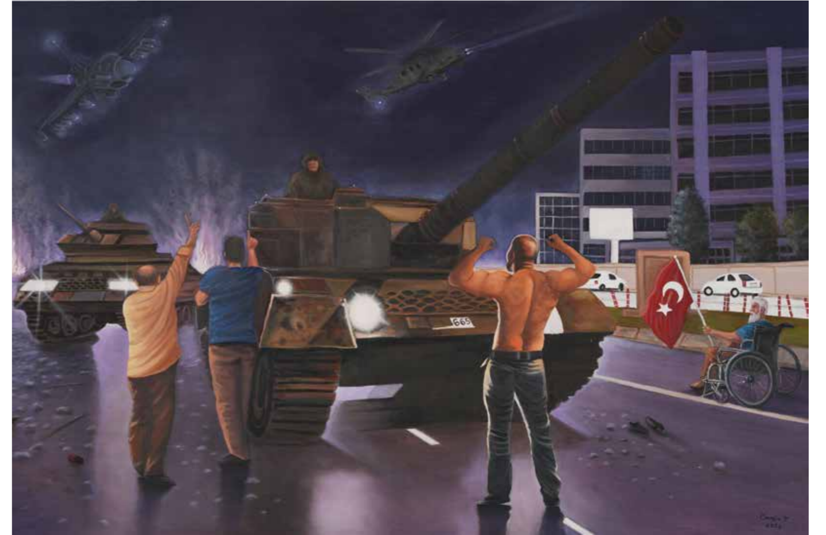
Cengiz Yavuz - 100x150 cm