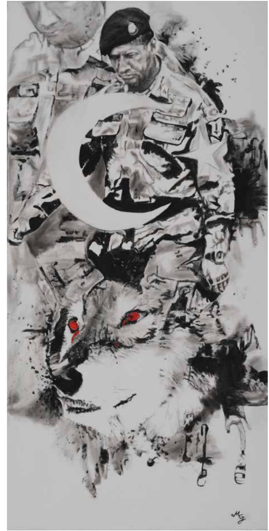
Muhterem Gürkan - 120x60 cm