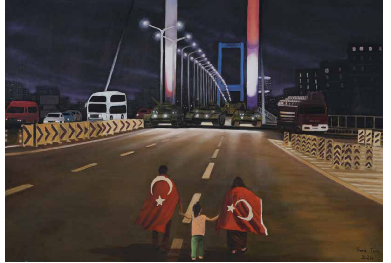
Sara Tunç - 70x100 cm