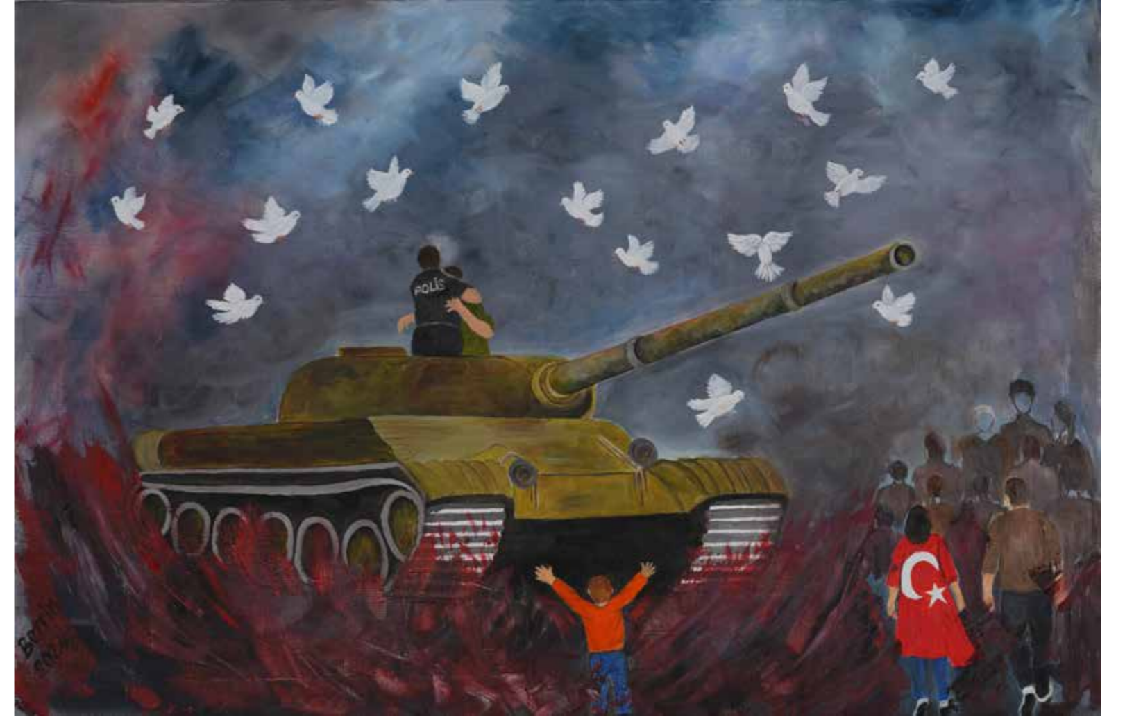
Berrin Temel - 90x60 cm