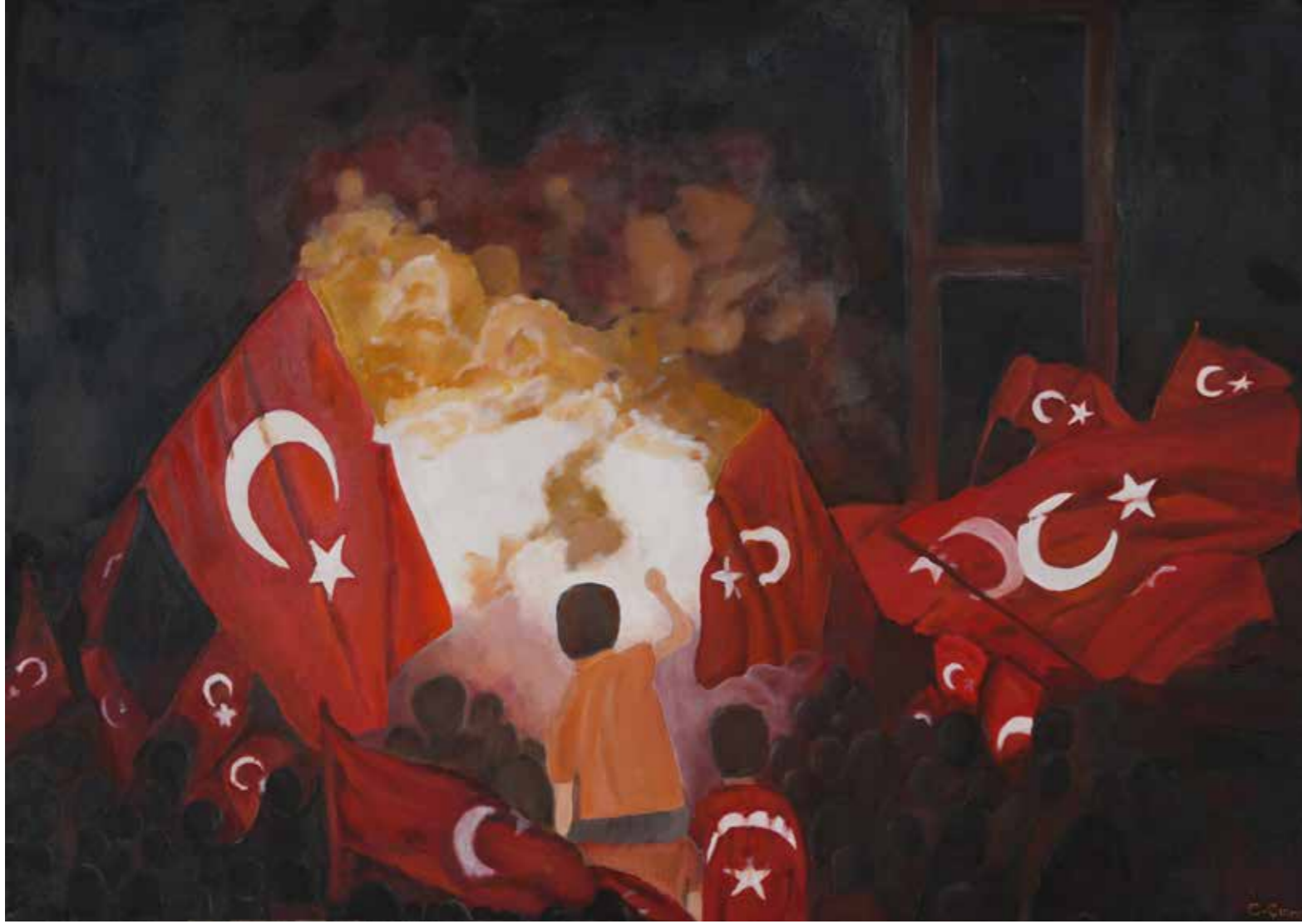
Cemile Çınar - 70x100 cm