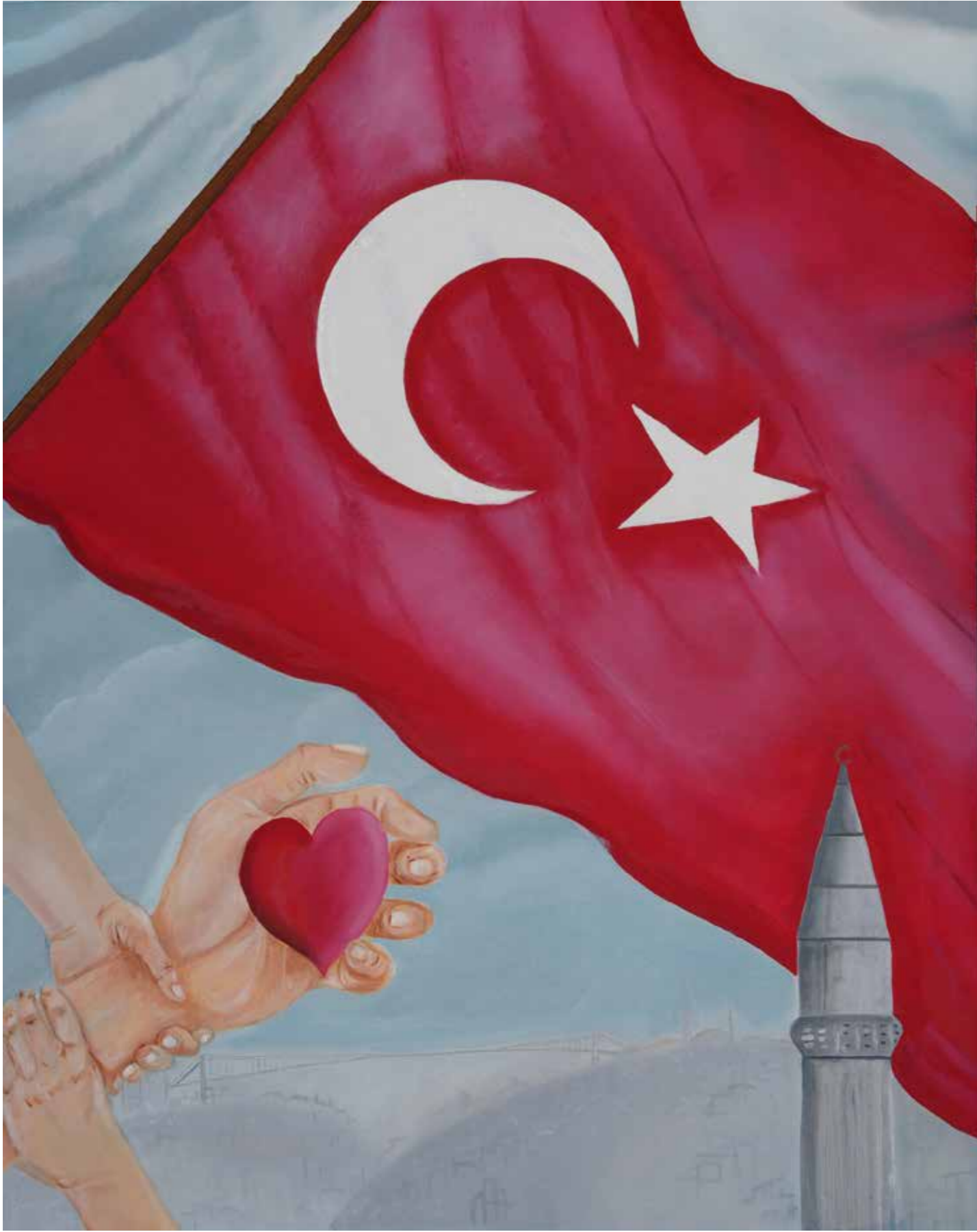
Nilüfer Başol - 80x100 cm