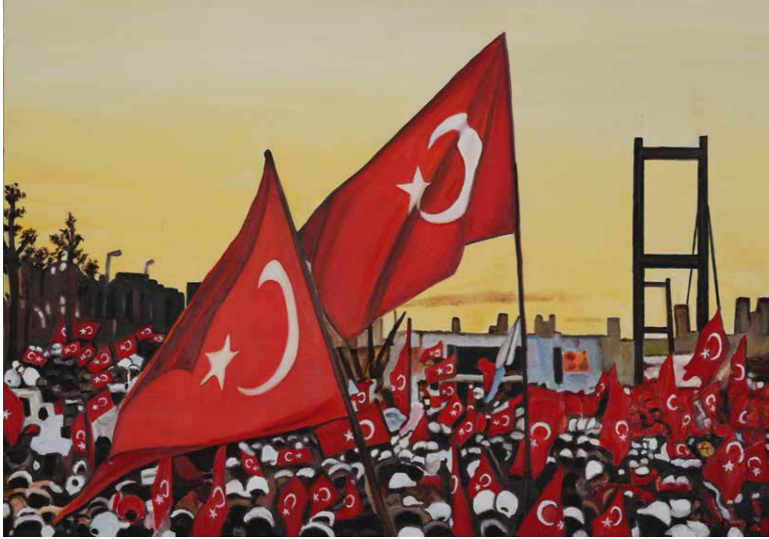
Deniz Uçar - 100x70 cm