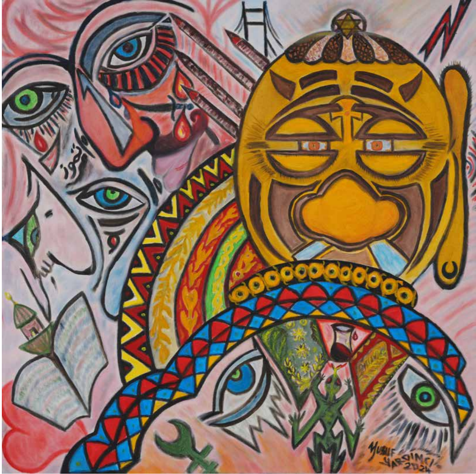
Yusuf Yardımcı - 80x80 cm