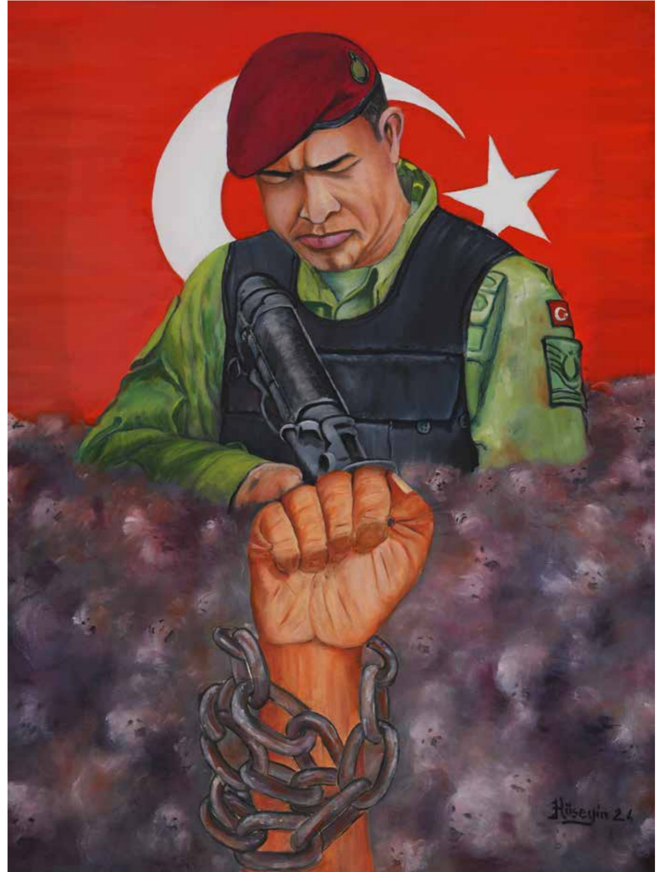
Hüseyin Çoban - 60x80 cm