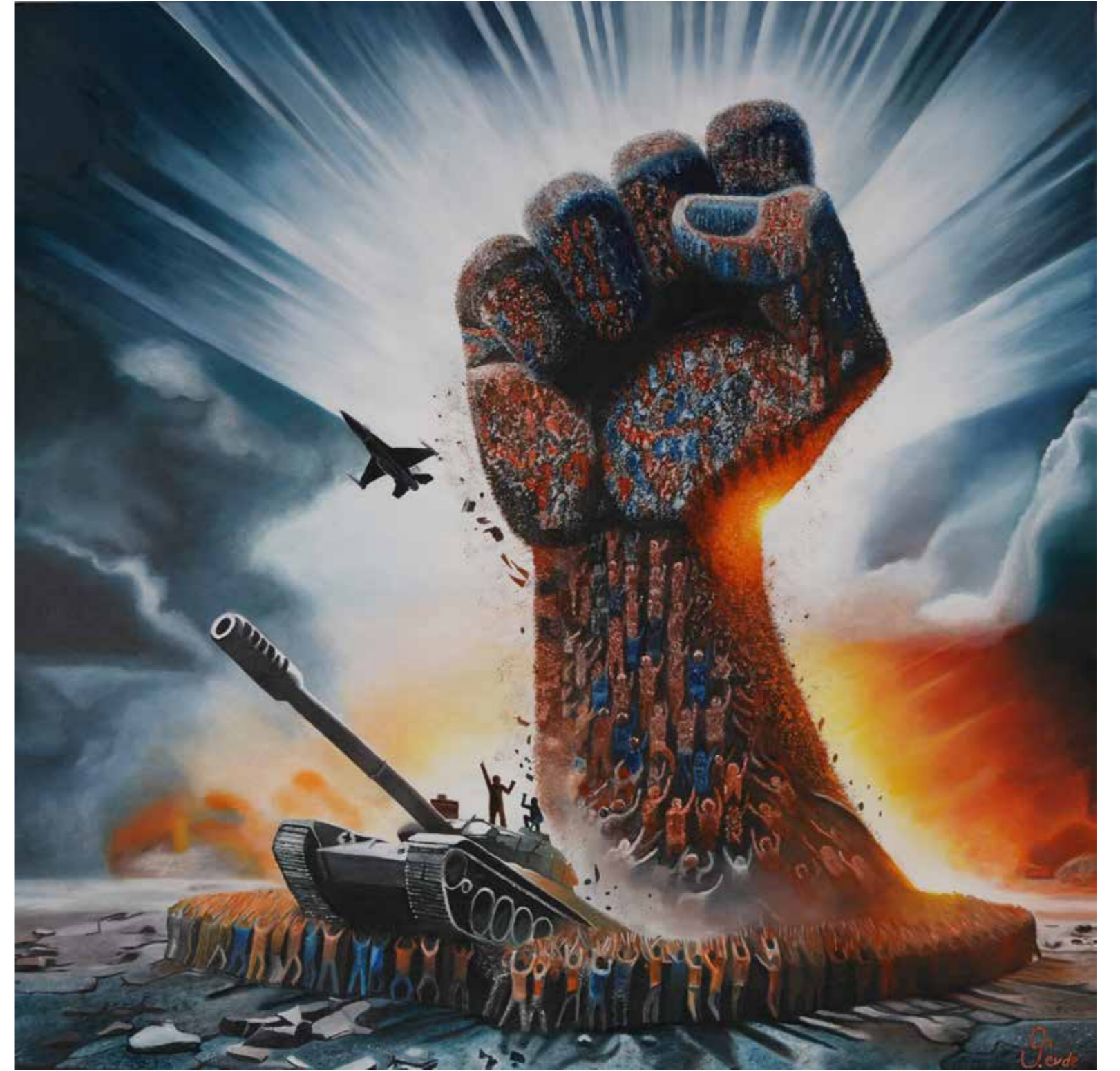
Sevde Yalçınkay - 100x100 cm